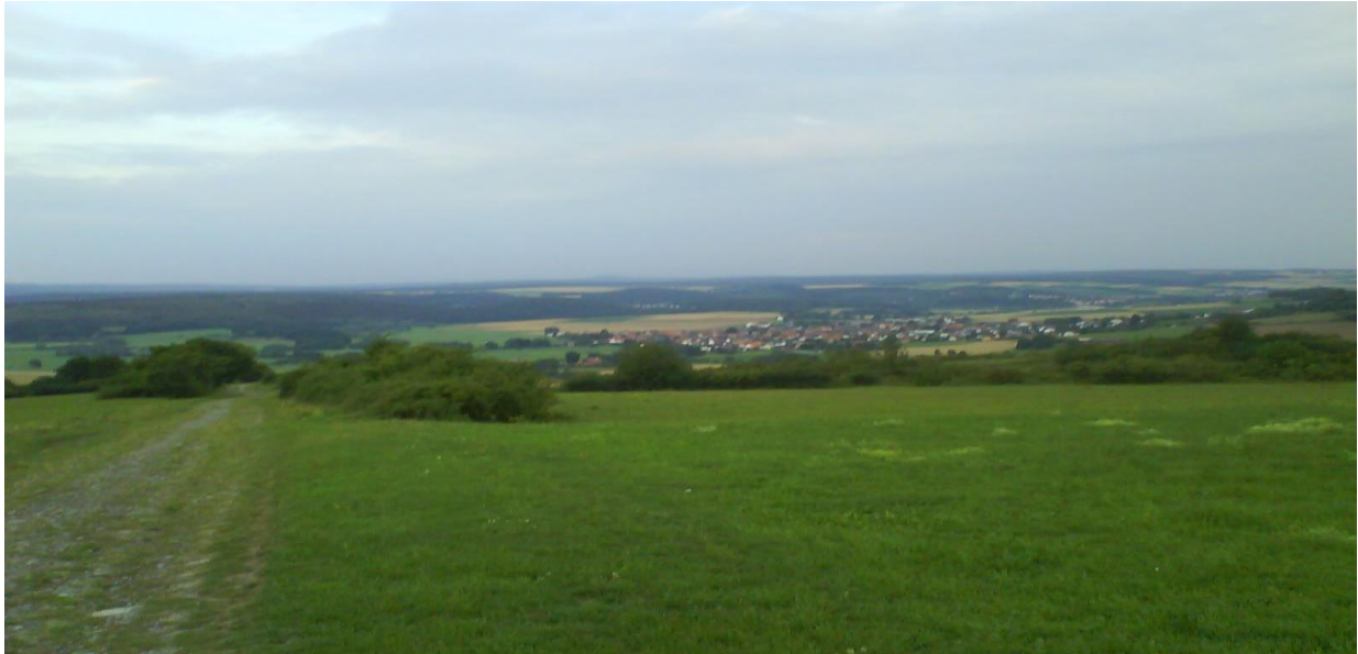
Blick vom Hölleberg

Links durch die Schranke auf den Deich, nach ca. 300m li. in den Ort, 100m weiter re. in die Steinstrasse bis zum Ende. Rechts auf B83, gleich wieder re. über die Diemelbrücke, direkt hinter der Brücke li. (Bürgerhaus) und sofort li. (noch vor dem Sportplatz) auf den Deich. Nach knapp 600m li am Wasserwerk hoch und li. auf den Diemelradweg (ehemaliger Bahndamm). Nach ca. 2km erreichst du die ersten Gebäude von Karlshafen und rollst weiter geradeaus zurück zum Hafensplatz (24,5km).